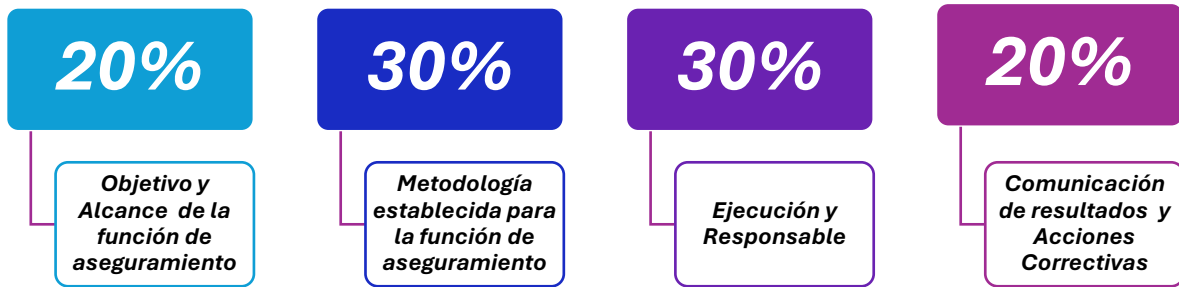
Gráfica No.2 – Elaboración Propia, Fuente: Instructivo Mapa de Aseguramiento, DAFF