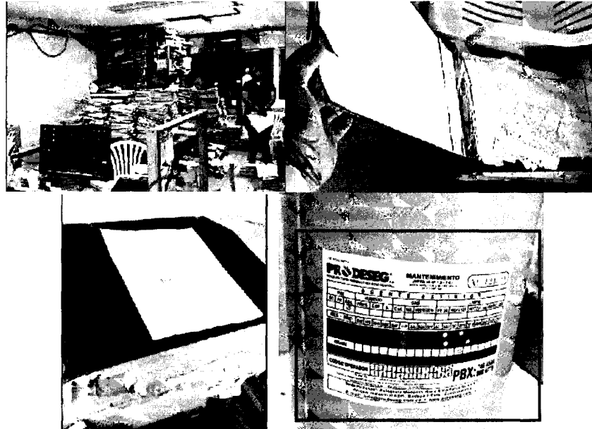
Fuente: Grupo Auditor en área de gestión documental

solicitud a Nivel Central para adelantar la gestión de almacenamiento en bodega correspondiente.