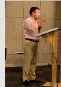
Capacitación en la ciudad de Barranquilla - Atlántico

- En materia procedimental, dispone que en la etapa instructiva (indagación preliminar y apertura de investigación), la actuación se hará como se viene haciendo, es decir, con un trámite escrito, mientras que en la fase de juzgamiento (que se inicia con la formulación de cargos al investigado), se aplicará el régimen de oralidad (audiencias).