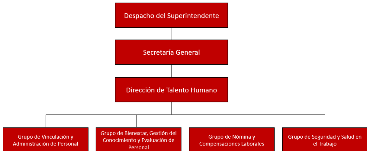
Ilustración 1 Organigrama